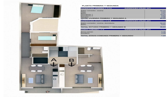
Planta Primera y segunda. Estudio B y Vivienda A