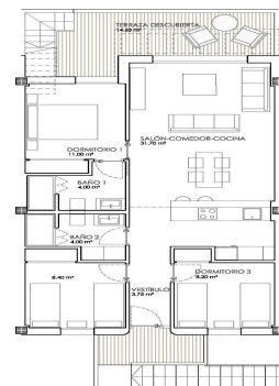
planta primera Sup. Construida VIV. = 80,46 m 2